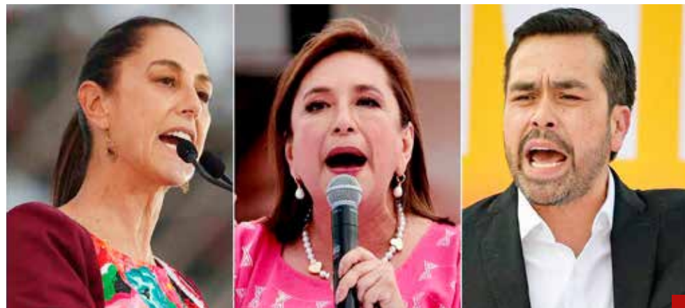
Dan los últimos toques de sus mensajes en todo el país.