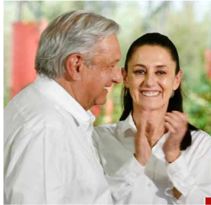
Defiende lo indefendible.