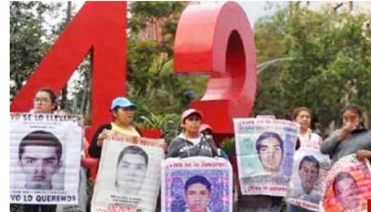
Desencanto y decepción de los padres de los 43 de Ayotzinapa por las promesas incumplidas del Ejecutivo federal.

voó la respuesta del Presidente AMLO, de la candidata presidencial oficial y del jefe de Gobierno de la CDMX, quienes se apresuraron a atacar a Ceci y se curaron en salud aseverando que son solo "polítiquerías electorales".