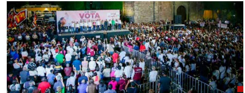
Sheinbaum trajo un mensaje de unidad y esperanza a Tlalnepantla.