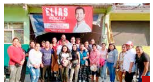
Impulsará el progreso de Naucalpan.