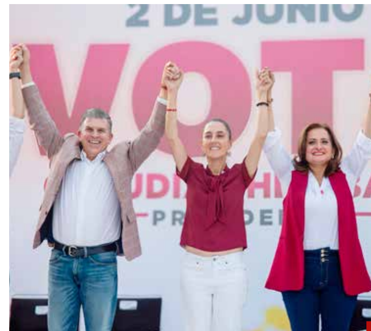
Morena no tiene ninguna esperanza en Jalisco.