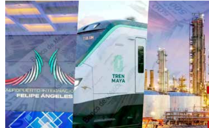
Los nuevos "elefantes blancos": AIFA, Dos Bocas y el Tren Maya.

La elección se comienza a cerrar, la tendencia apunta a unas elecciones mucho más competida de lo previsto. Se está poniendo de manifiesto que las encuestas pagadas, que ponen a la candidata del gobierno más de 20 o 30 puntos arriba, sirven para desalentar, aunque no para ganar. Siempre se ha sostenido que "Local is pholitics", en este sentido el comportamiento que se está dando en las diferentes entidades federativas será decisivo en los resultados finales de las elecciones más grandes de la historia de México.