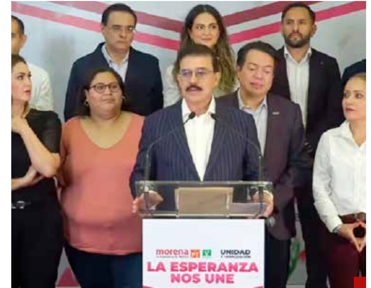
Imposible que gane la 4T en Guanajuato.