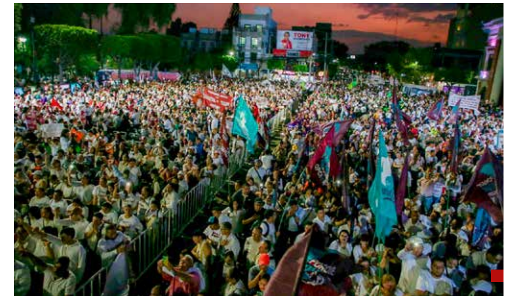
Más de 20 mil personas asistieron al evento.

Por todo ello, dejó claro que ya nada, ni nadie, frena el movimiento de transformación y, sin duda, Tlalnepantla será un ejemplo de democracia y dará una lección de dignidad el próximo domingo 2 de junio en las urnas.