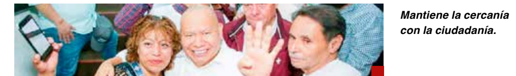
Mantiene la cercanía con la ciudadanía.