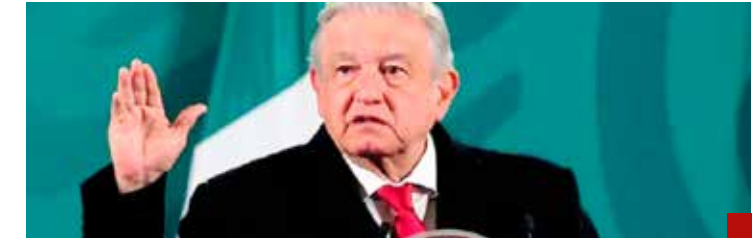
Aunque AMLO tiene popularidad muy alta, los resultados de su gobierno son muy desfavorables.

Hay que recordar que el dinero del Fondo de Desastres Naturales (Fonden) lo desaparecieron. Otros temas más recientes, que han causado polémica preocupación y malestar en muchos electores, son el decomiso de ahorros de las Afores de los mayores de 70 años, la reforma a la Ley de Amparo que deja desprotegidos a los más pobres y vulnerables respecto de casos de violación de garantías constitucionales por actos