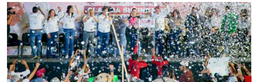
Raciél asegura que la primavera de la transformación llevará a Claudia a ser la primera Presidenta de México, emanada del movimiento de la Cuarta Transformación.