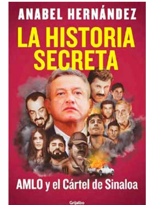
"La historia secreta", de Anabel Hernández, detalla los vínculos presidenciales con el narco de manera extensa.