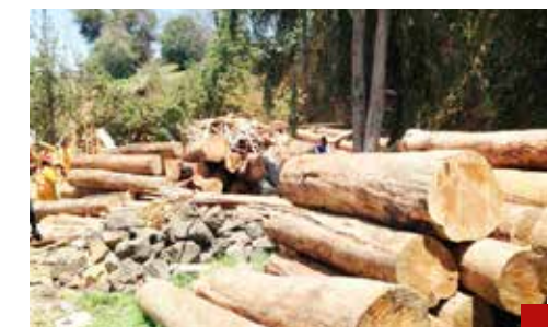
Piden inspección y labores de vigilancia.

Para su análisis y posible dictaminación, la propuesta presentada por la legisladora priísta fue turnada a las Comisiones de Gobernación y Puntos Constitucionales, y de Protección Ambiental y Cambio Climático.