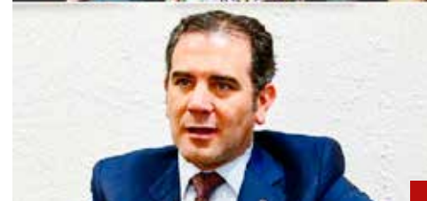
Omar García Harfuch, el único seguro en el gabinete de la 4T, estaría en la Secretaría de Seguridad y Protección Ciudadana.