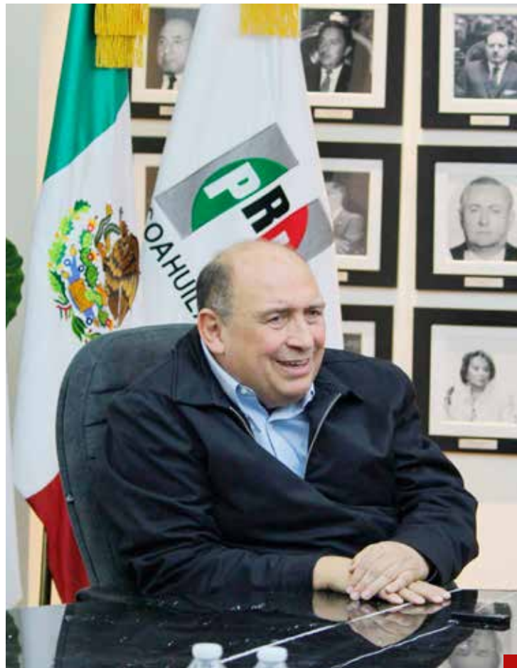
“El gobierno dejará muchos pendientes”.