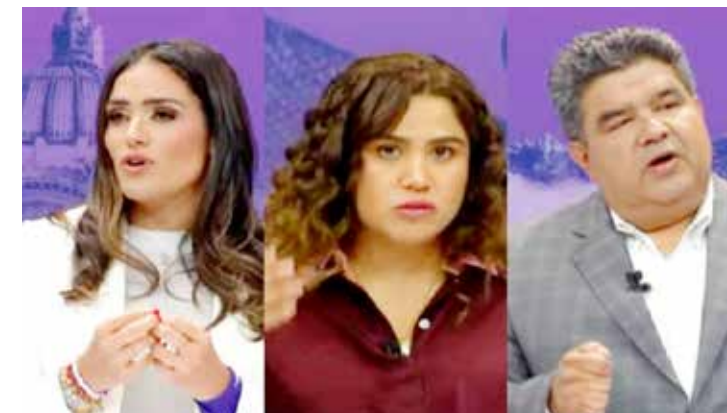
Durante el debate, Ale fue la única candidata que dio propuestas.

Cuantitas le da ventaja de dos puntos a la abanderada de Va x por la CDMX.