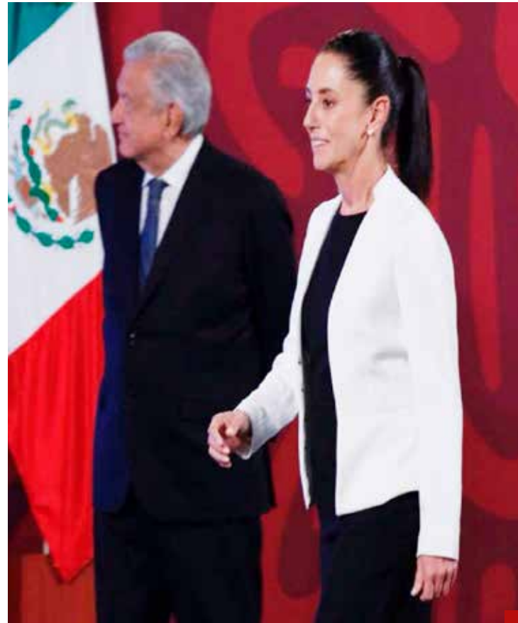
Sheinbaum, atada a las indicaciones de Palacio Nacional.