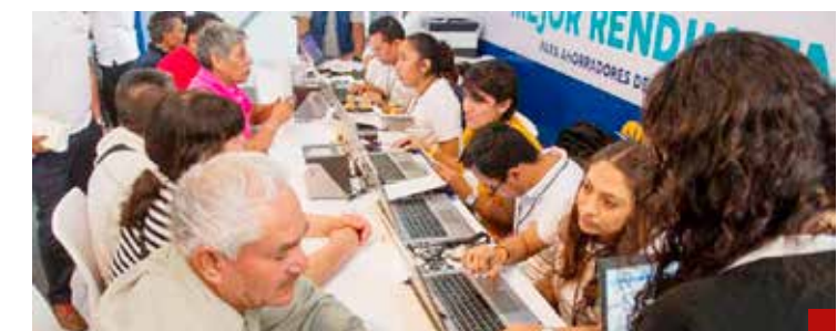
El gran perdedor es el mismo de siempre: los que menos tienen, los trabajadores.