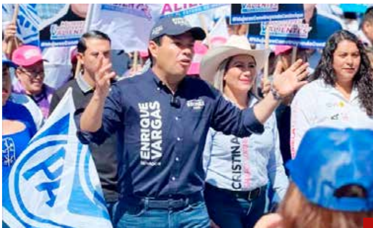
Será el senador más trabajador para beneficio de los mexicanos.