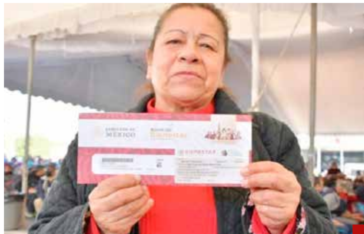
Los programas sociales seguirán porque están en la Constitución Política.