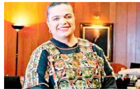
Entre Beatriz Paredes y Lorenzo Córdova estaría el titular de Segob en el gabinete de Xóchitl.