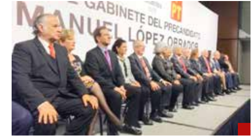
En 2017 Andrés Manuel López Obrador anunció a los integrantes de su equipo de trabajo.

SEGURIDAD PÚBLICA: Rubén Moreira, Francisco Cabeza de Vaca, Omar García Harfuch.