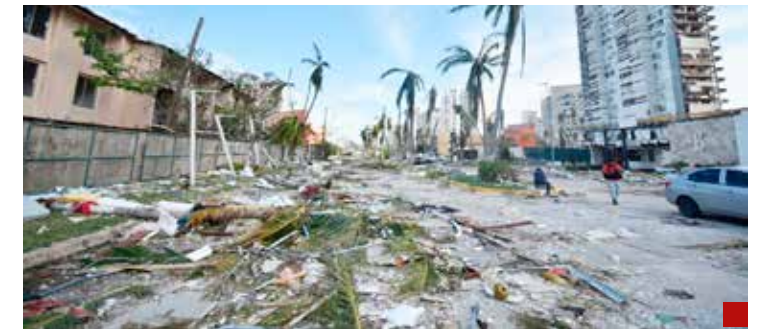
Acapulco nunca será lo mismo por la falta de un plan integral de rescate.