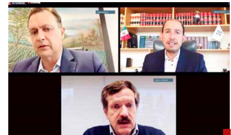
PAN, en contra del "agandalle" de Morena.