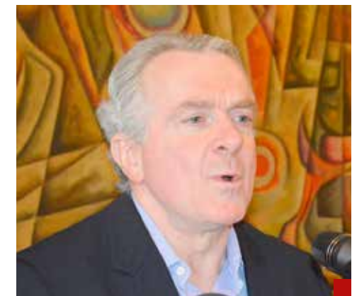
Santiago Creel Miranda, en la CFE de ganar la oposición.