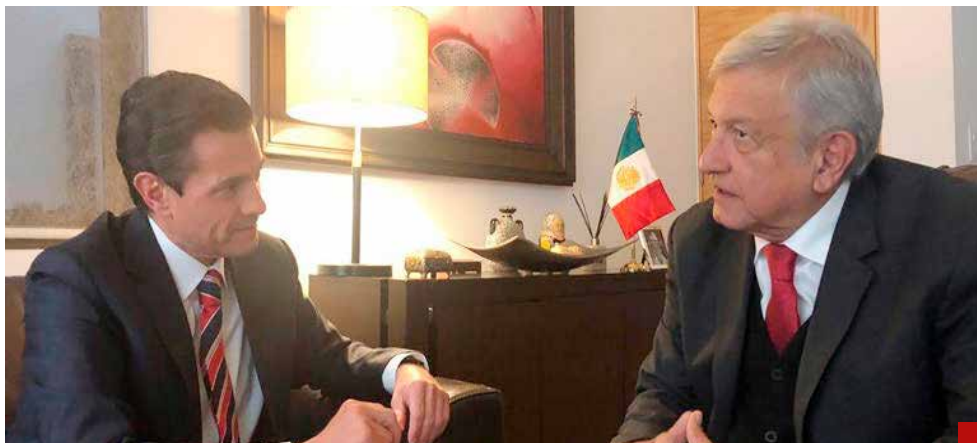
Enrique, te comportaste como un demócrata: AMLO a Peña.