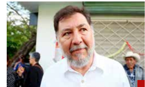
Gerardo Fernández Noroña, en la Secretaría del Trabajo con Sheinbaum Pardo.