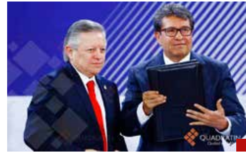
Entre Arturo Zaldívar y Ricardo Monreal estaría el titular de Segob en el gabinete de Claudia.

México podría tener el primer gobierno de coalición, un gobierno que se traduzca en "unidad y reconciliación nacional" para iniciar una nueva etapa en la vida política nacional y así construir el México justo y próspero que todos queremos.