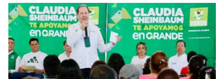
Alejandro Moreno acusa a Eruviel de peculado y desvío de recursos públicos cuando fue gobernador mexicano.