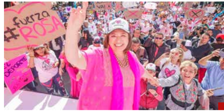
Confianza en el triunfo de Xóchitl Gálvez.