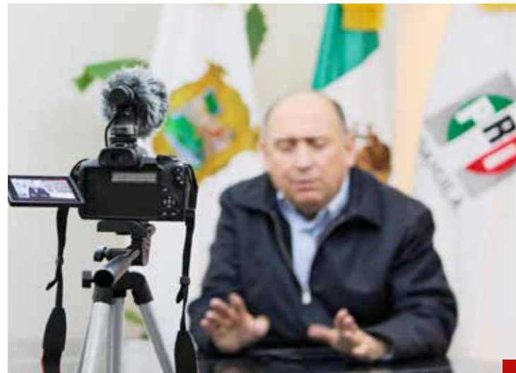
“La Línea 12 del Metro es una puntada”.