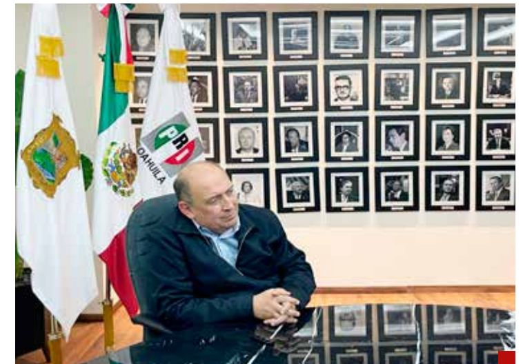
“Morena se tiene que ir del gobierno”.