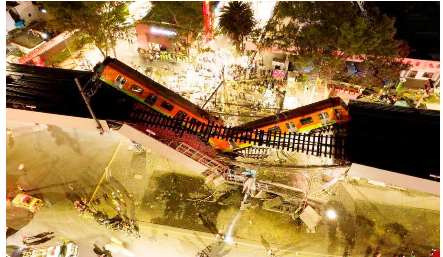
La única línea que hizo la izquierda se les cayó.