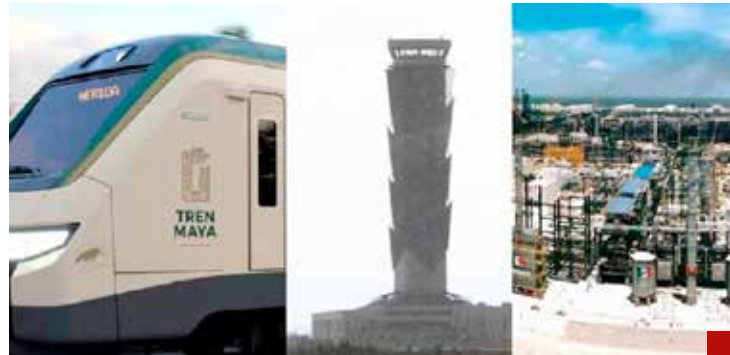
Las obras faraónicas se plantearon sin el conocimiento técnico.