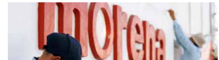
Morena, un bote de "basura política".