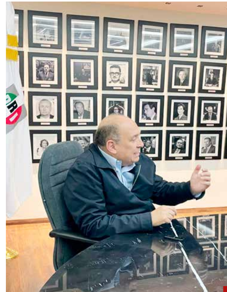
“Exigimos que ya se vote la iniciativa de los 60 y más”.