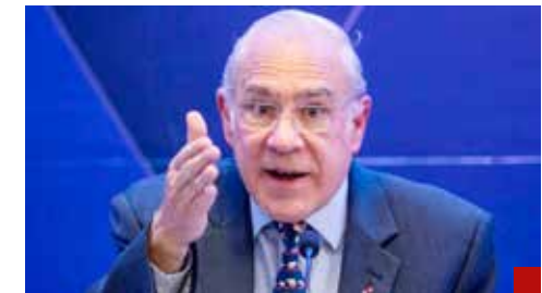
No sólo es hacer la coalición, hay que usarla: José Ángel Gurría Treviño.