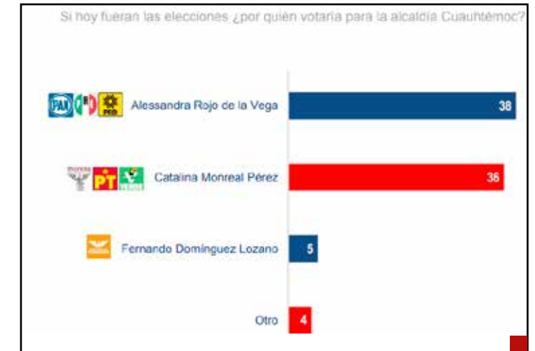
El 38 por ciento va por Rojo de la Vega.